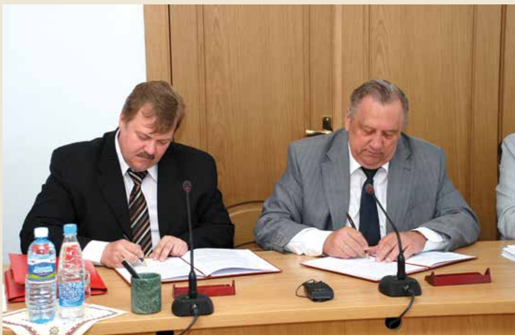
20 июня 2011 года. Подписание Соглашения о взаимодействии между Государственным Собранием Республики Марий Эл и Следственным управлением Следственного комитета Российской Федерации по Республике Марий Эл.