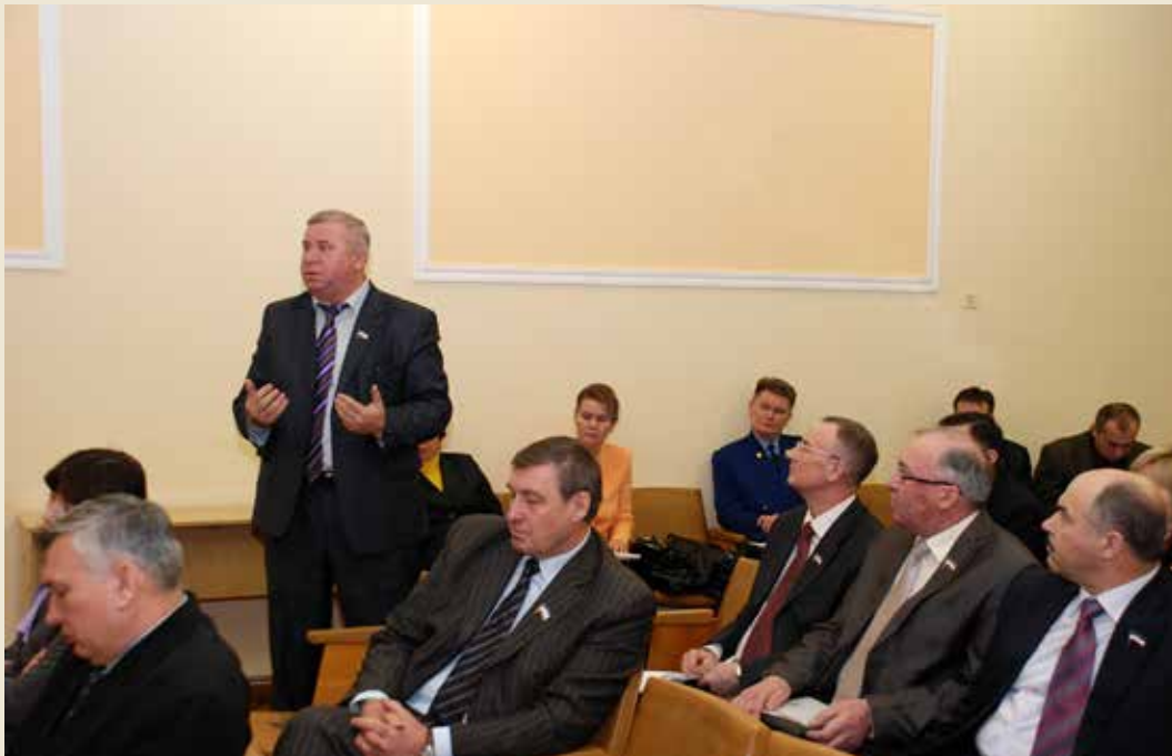
3 февраля 2011 года. Выездной День депутата в Общественно-политическом центре Республики Марий Эл, посвященный тарифам на жилищно-коммунальные услуги.