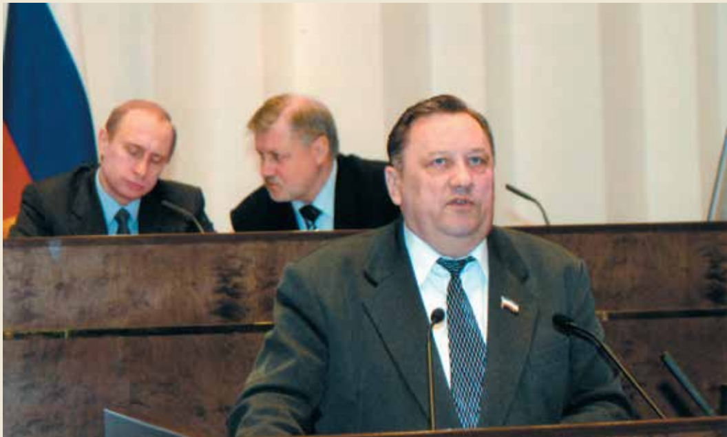
18 февраля 2003 года Москва. Заседание Совета законодателей России с участием Президента Российской Федерации Путина В.В.