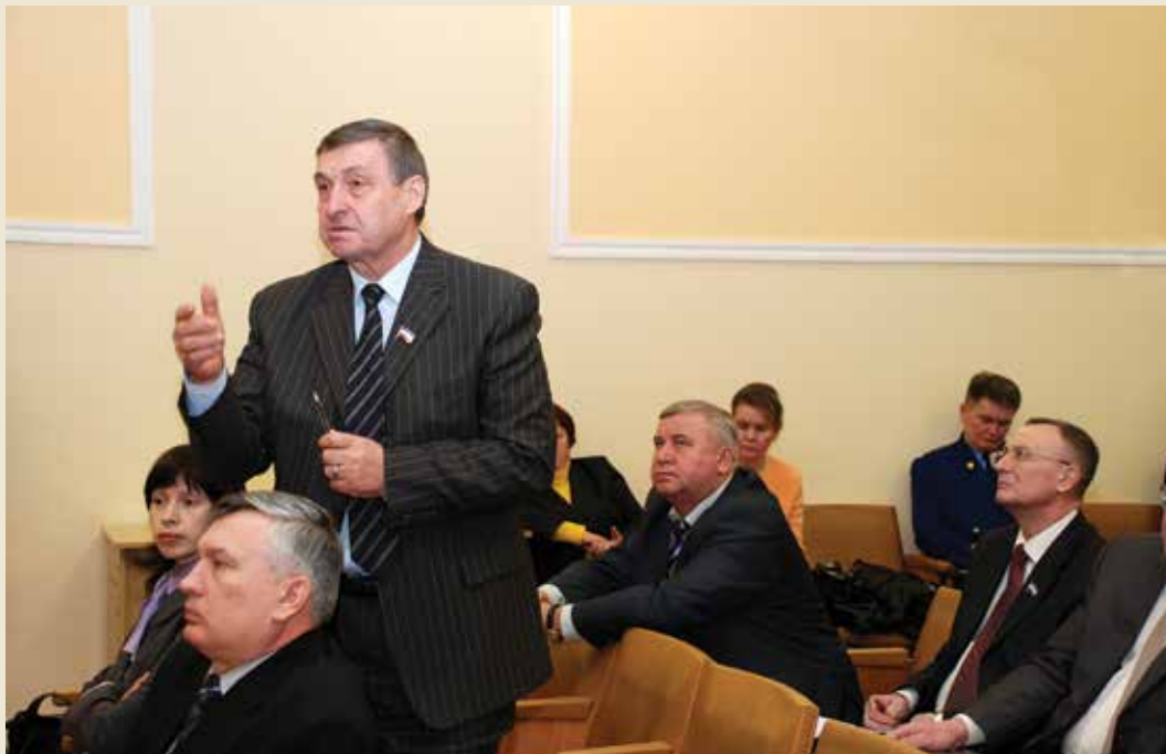
3 февраля 2011 года. Выездной День депутата в Общественно-политическом центре Республики Марий Эл, посвященный тарифам на жилищно-коммунальные услуги.