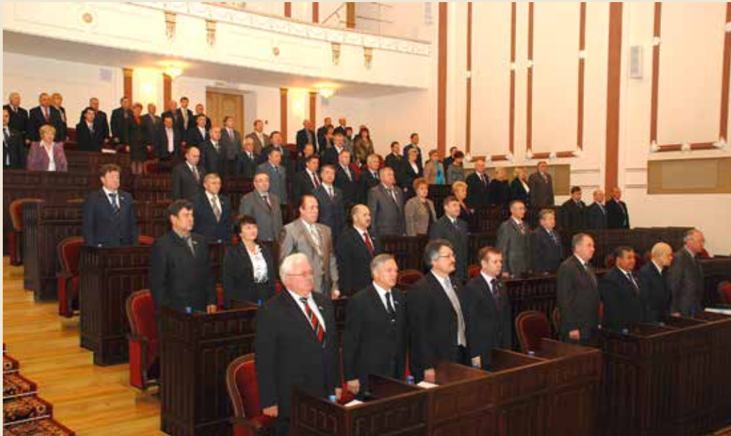
21 октября 2010 года. XII сессия Государственного Собрания Республики Марий Эл V созыва.