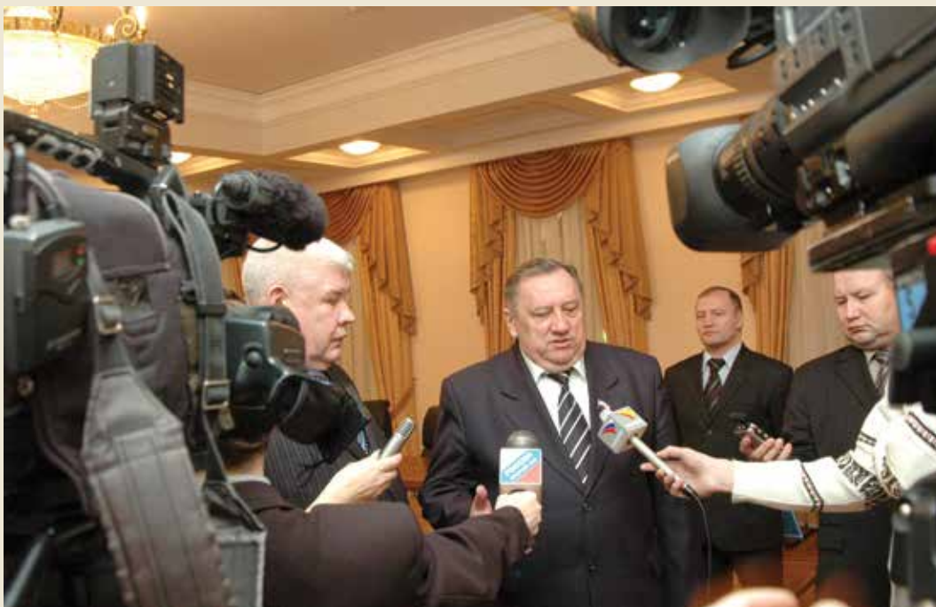
8 декабря 2006 года. г. Чебоксары. Пресс-конференция по случаю подписания Соглашения о межпарламентском сотрудничестве между Государственным Собранием Республики Марий Эл и Государственным Советом Чувашской Республики.