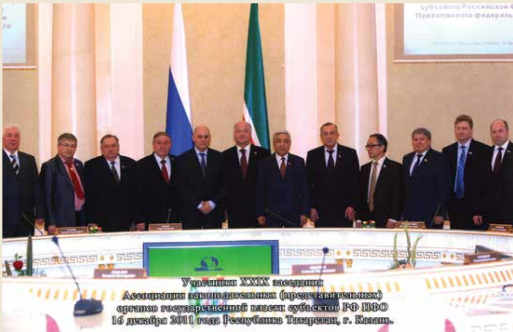
16 декабря 2011 года. г. Казань. Участники XXIX заседания Ассоциации законодательных (представительных) органов государственной власти субъектов Российской Федерации Приволжского федерального округа.