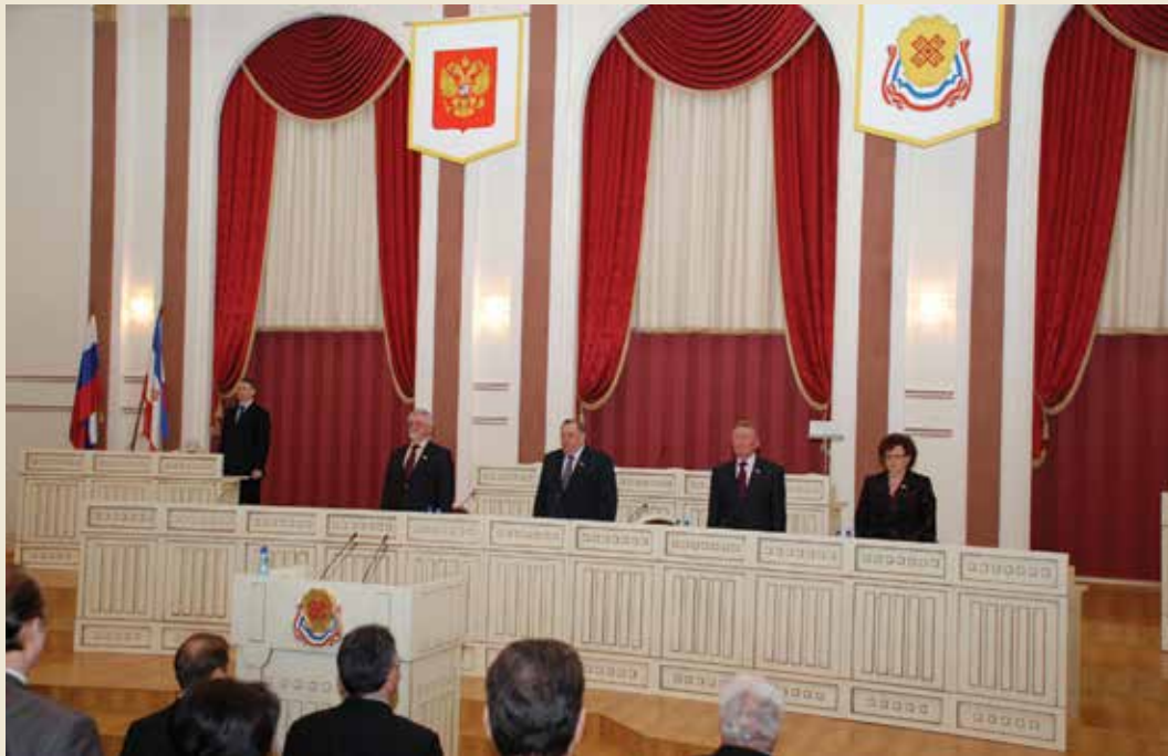
25 февраля 2010 года. VII сессия Государственного Собрания Республики Марий Эл V созыва.